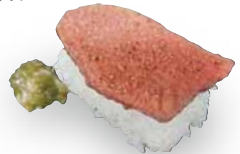
上霜降り寿司 1貫 399円(税込438円)