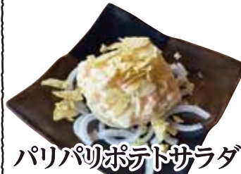
パリパリポテトサラダ 499円(税込548円)