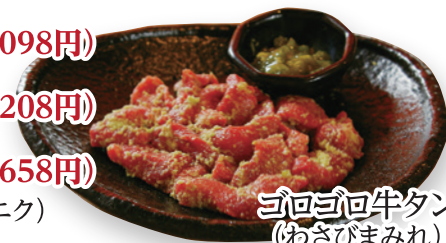
ゴロゴロ牛タン (わさびみみれ)