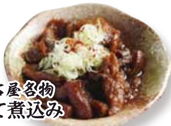
名古屋名物 どて煮込み 399円(税込438円)