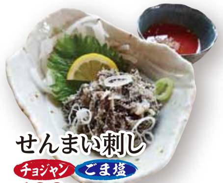
せんまい刺し チリヤン ごま塩 699円(税込768円)