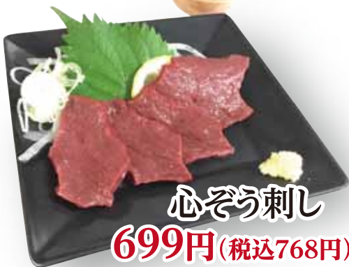
心ぞう刺し 699円(税込768円)