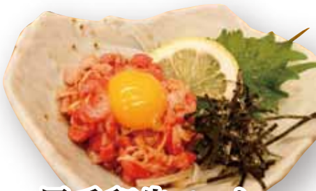
黒毛和牛ユッケ (レアステーキ) 899円(税込988円)

精肉店直営だからこそ、提供できる新鮮なお肉を使用した贅沢な前菜 すべて 数量限定 です。