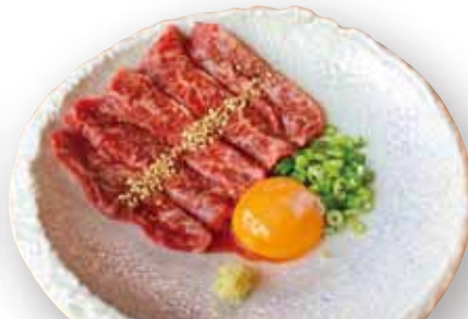
国産牛 上ハラミユッケ 1,099円(税込1,208円)