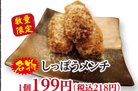
数量限定 名物 しつぽうメンチ 1個 199円(税込218円)